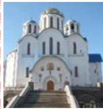
Храм Покрова Пресвятой Богородицы в Ясенево